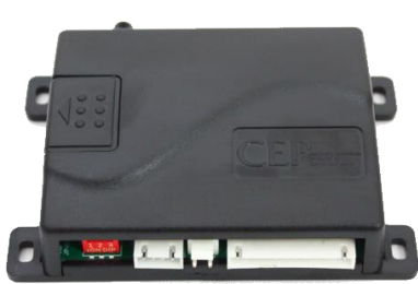
コントローラ 1 個