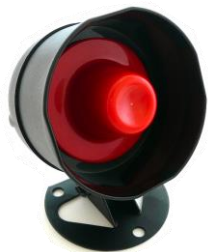
スピーカー 1 個